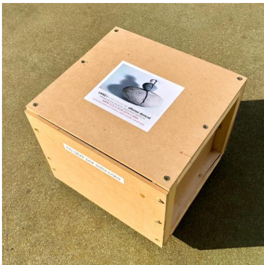
caja Land I : 27,7 cm alto x 33,54 ancho x 32 cm prof.

Las esculturas se entregan embaladas en una caja sólida, listas para transporte remoto. Se accede a la obra quitando 4 ó 6 tornillos en la tapa superior. Debido al elevado peso de las piezas, deben manejarse con precaución. Las cajas disponen de antideslizantes de goma en la superficie de contacto con el suelo.