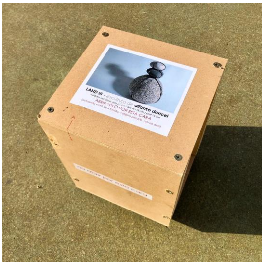
caja Land III : 28 cm alto x 22 ancho x 20,5 cm prof.