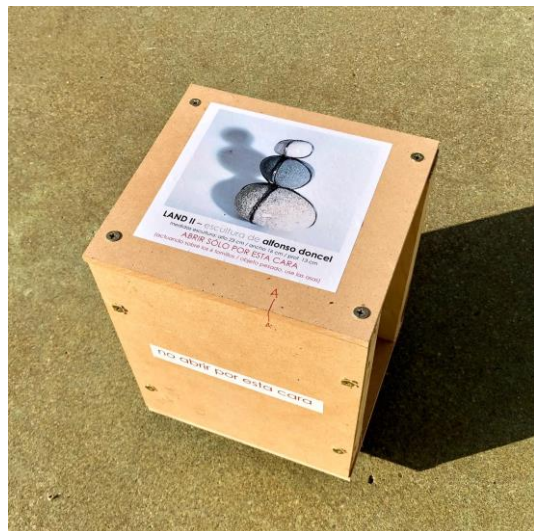
caja Land II : 26 cm alto x 21 ancho x 18,5 cm prof.