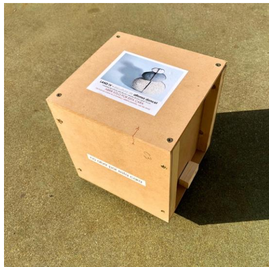
caja Land IV : 29 cm alto x 26,5 ancho x 25,5 cm prof.